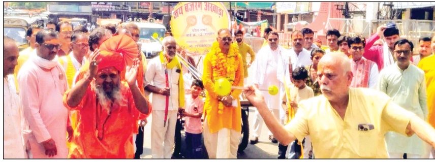
हरिभूमि न्यूज ▶▶ रायसेन

भृगुकुल नंदन भगवान परशुराम जयंती महोत्सव के अवसर पर रविवार को शहर में सर्व ब्राह्मण समाज के तत्वावधान में भव्य शोभायात्रा निकाली गई। सिद्ध दादाजी हनुमान मंदिर, गंजबाजार से प्रारंभ हुई इस शोभायात्रा ने पूरे शहर का माहौल भक्तिमय बना दिया। डीजे और बैंडबाजों ढोल नगाड़ों की धुन पर "जय भगवान परशुराम" और "जय विप्र समाज" के जयकारों से पूरा नगर गूंज उठा।